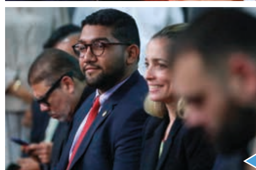
Diputados felicitan al recién ratificado director general del IFARHU.