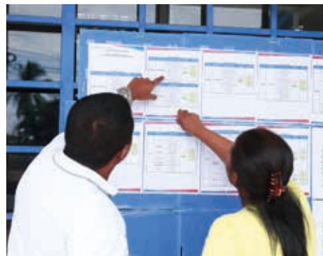
Pago de Becas en Panamá Oeste.

estudiantes con beneficio de becas y asistencias económicas del 2023, recibieron su beneficio a nivel nacional.