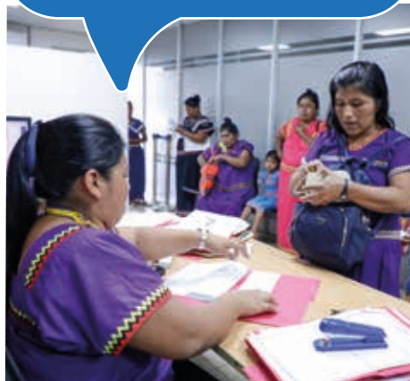
Pago de Becas en la Comarcal Ngäbe Buglé.

La buena organización nos permite dejar a nuestros hijos en las escuelas, cobrar rapidito y dirigirnos a nuestros trabajos"