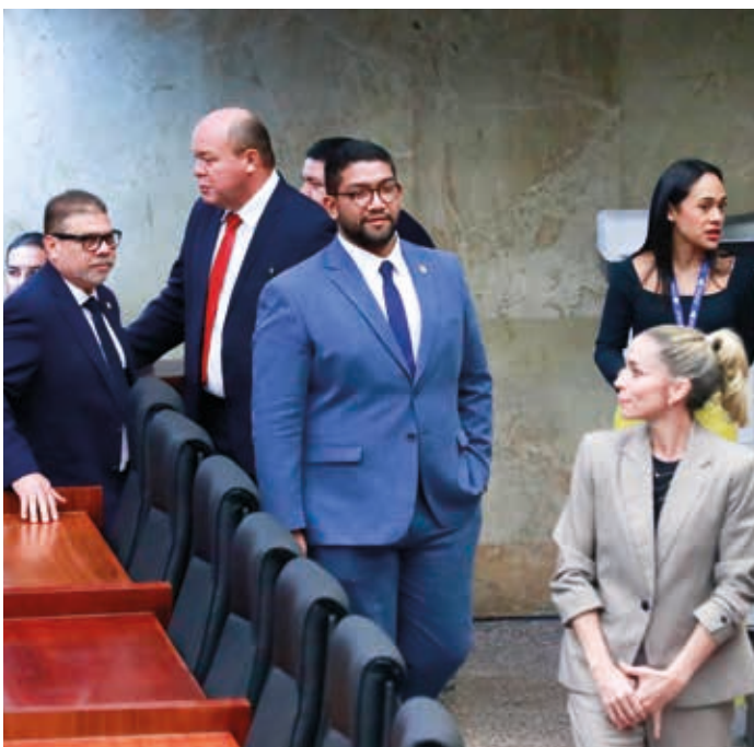
Día 2: Ingreso al Pleno de la Asamblea Nacional de Diputados.